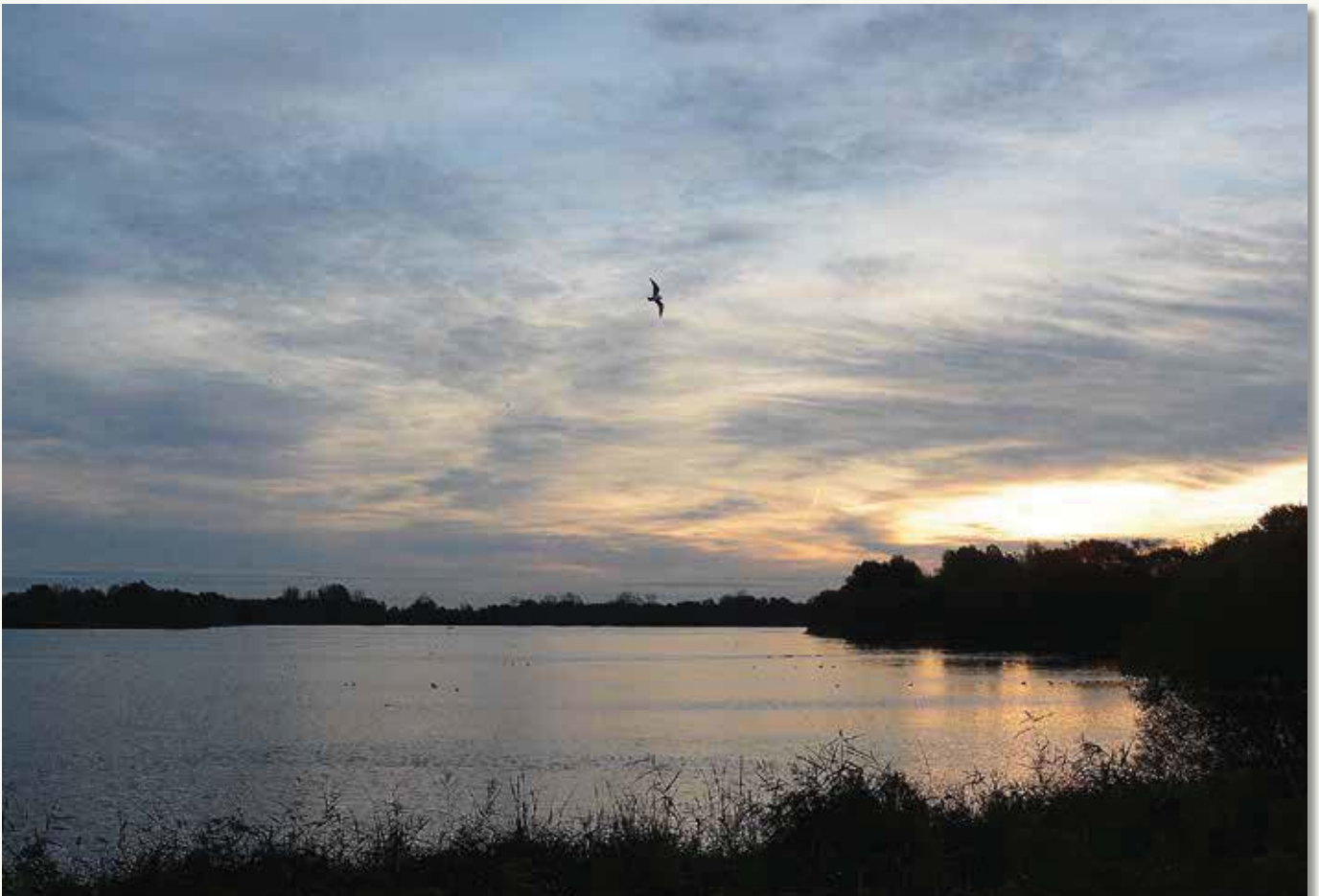
Tussen 1973 en 1976 werd het zand van de oude binnenduinen van Roksem ontgonnen voor de aanleg van de snelweg Jabbeke-Veurne. Zo ontstond een plas van 40 hectare die een enorme aantrekkingskracht heeft op watervogels. De actiegroep die ijverde voor de bescherming van dit gebied groeide later uit tot 'De Vrienden van de Hoge Dijken vzw'.

Begin jaren '80 gebruikte Bloso dit gebied voor actieve waterrecreatie, zoals