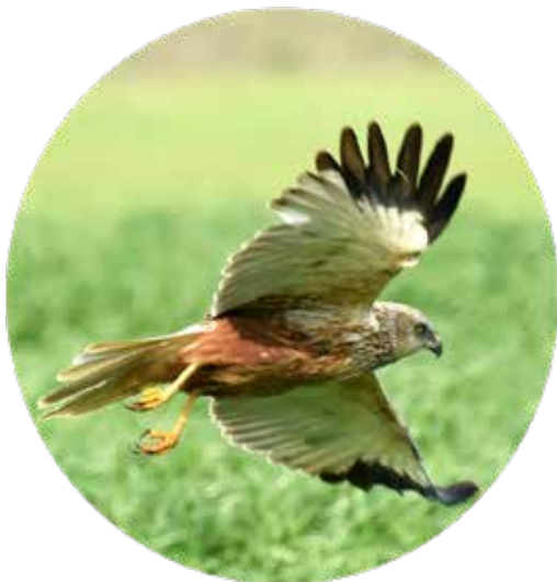
Bruine kiekendief- Geert Declercq