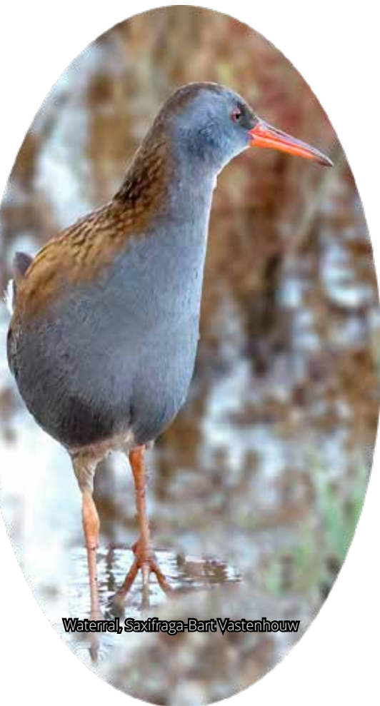
Wateraal, Saxifraga-Bart Vastenhouw